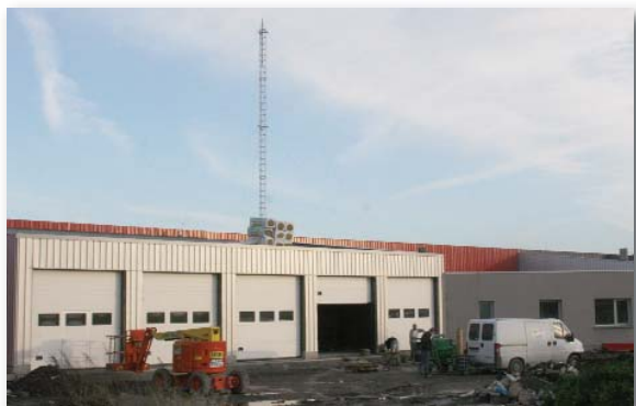
Le CIS d'Harnes en construction sera livré pour mi 2010.

l'ajout d'un sas VSAV et d'une zone d'hébergement et de restauration permettront au personnel de disposer de meilleures conditions de travail à Vitry, avec 400m 2 de plus.