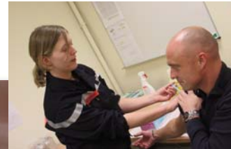
...et centre de vaccination de Calais.

Après un début de campagne extrêmement timide, on a observé une progression de la fréquentation : le bilan au 17 décembre fait état de 210 personnes vaccinées, soit moins de 3% du public prioritaire.