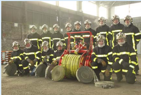
F1 SPV Arcelor Mittal - Thyssenkrupp

Une opération similaire est lancée en association avec Arcelor Mittal et Thyssenkrupp. La 1 ère session de 14 stagiaires s'est achevée le 20 décembre. Les deux sociétés ont apporté une plus-value notable en détachant en tant que formateurs des sapeurs-pompiers volontaires de leur propre personnel (Moniteur secourisme et instructeurs incendie). Autre innovation : les stagiaires de Arc International devant rattraper des modules de formation peuvent aussi bénéficier de cette session. Les stagiaires en situation de chômage touchent cette fois leur vacation en totalité. Des contacts ont aussi été pris chez Ceca Feuchy et chez Roquette Frères, qui orienterait la promotion du volontariat vers l'agro-alimentaire, qui est un secteur encore peu exploré.